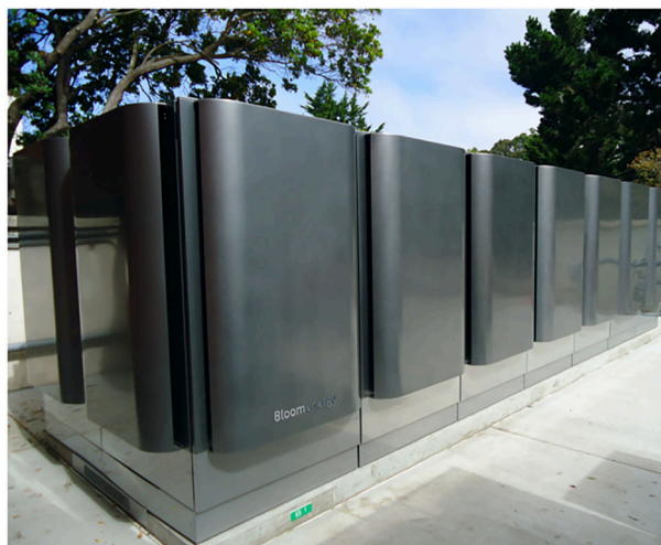
图1 BE公司固体氧化物燃料电池发电系统

日本在新能源产业技术综合开发机构（NEDO）的领导下，固体氧化物燃料电池规划主要包括家用型（千瓦级）以及电厂型（兆瓦级及以上）等，日本从2005年开始启动家用燃料电池热电联供（ENE-FARM）计划，对ENE-FARM进行示范运行及政府补助，因此目前以家用小型热电联供系统最